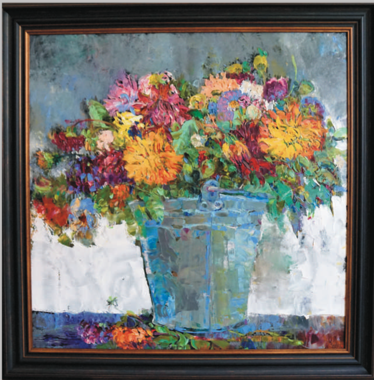
ŠARŪNAS ŠARKAUSKAS „Jurginiai“ 70x70 cm, drobė, aliejus, 2019 m.