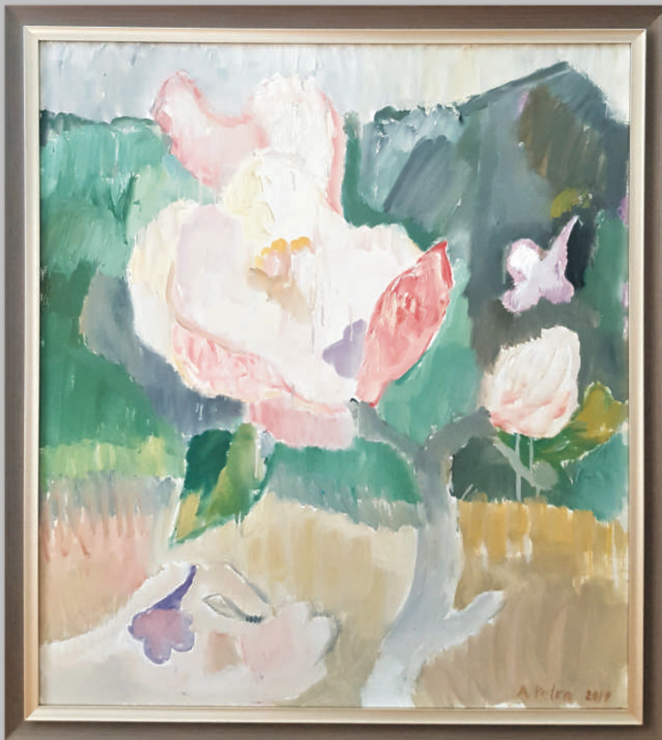
AUDRONĖ PERTRAŠIŪNAITĖ „Obels žiedas“ 90x80 cm, drobė, aliejus, 2019 m.