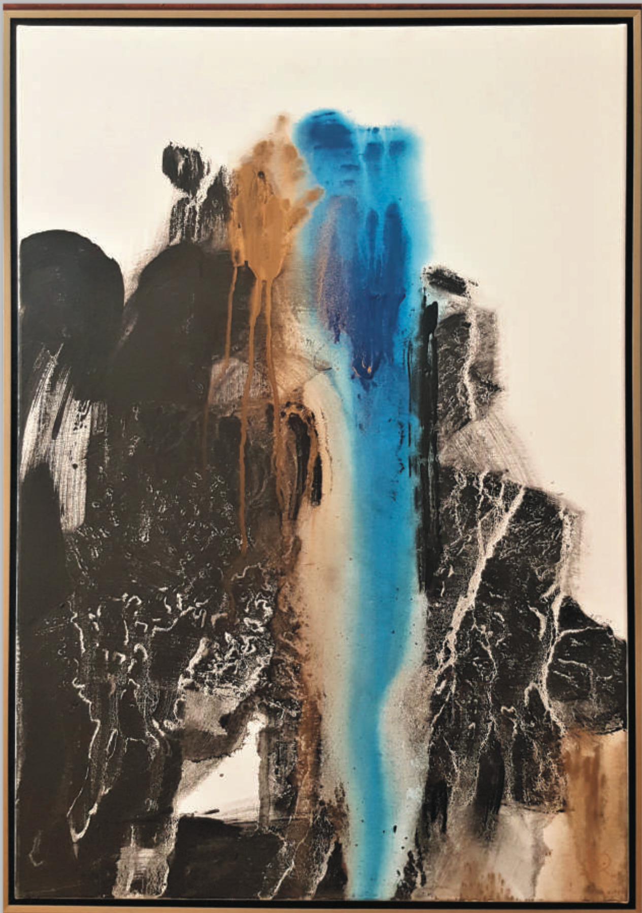
DALIA KIRKUTIENĖ „Šaltinis“ 100x70 cm, drobė, akrilas, bronzas, 2019 m.