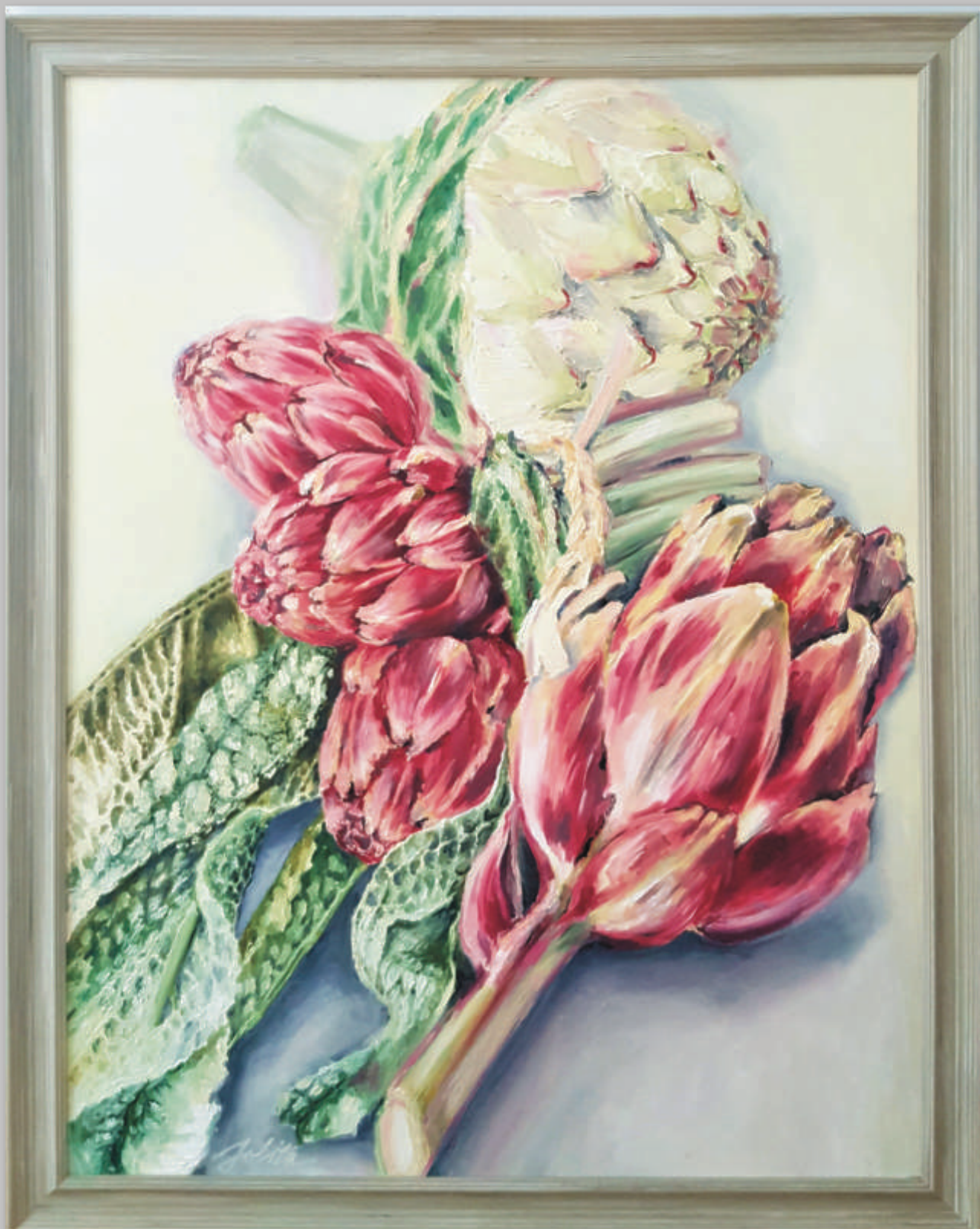
JOLITA LINKEVIČIŪTĖ „Artišokai“ 90x70 cm, drobė, aliejus, 2019 m.