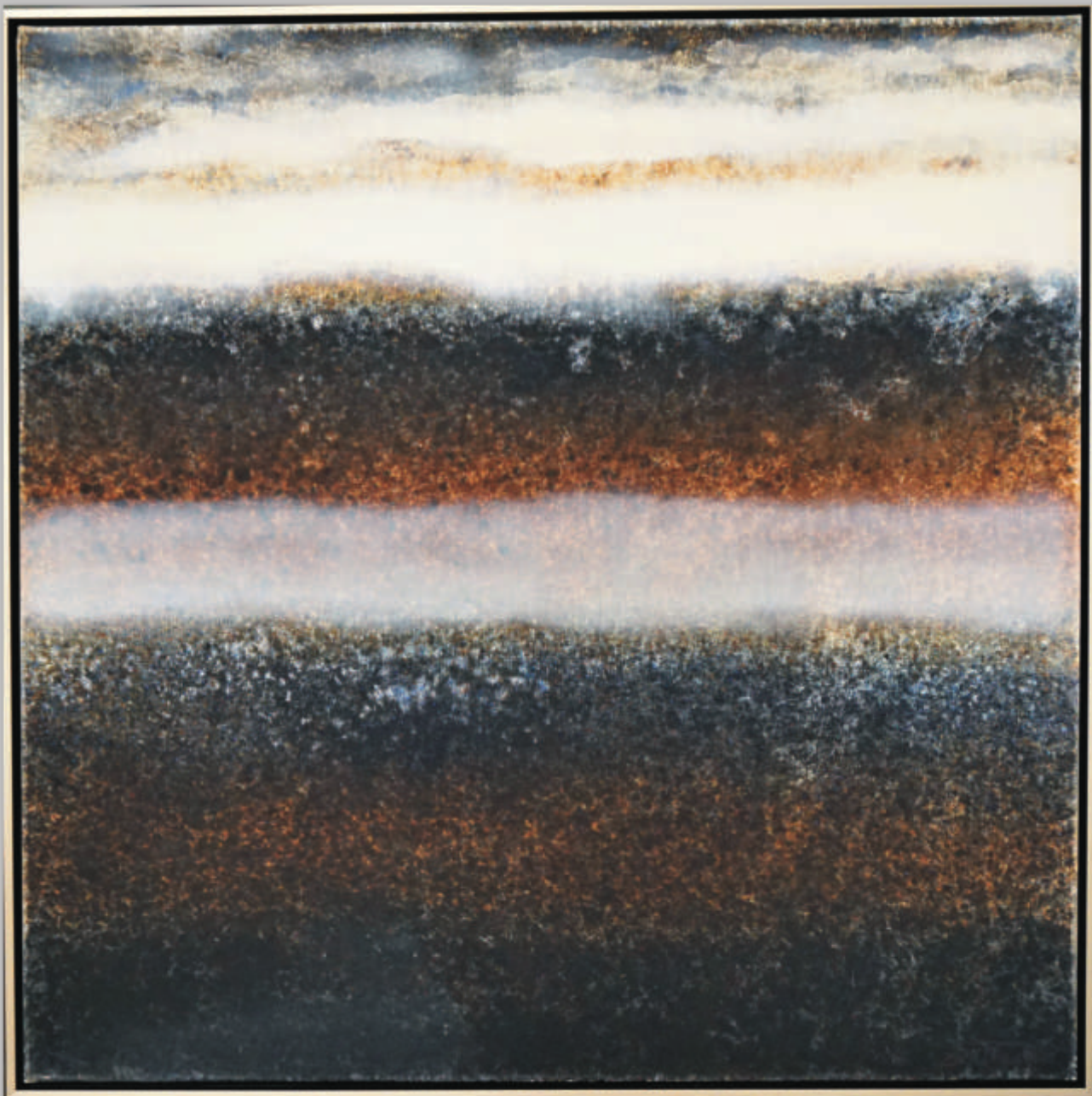
AUDRIUS GRAŽYS „Lygiadienis“ 100x100 cm, drobė, aliejus, 2020 m.