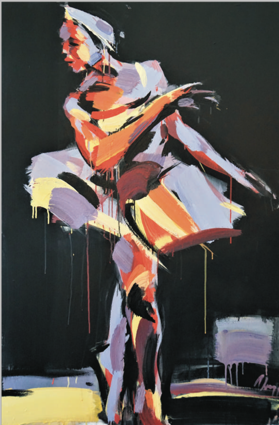
VIRGINIJUS VININGAS „Odetos šokis“ 120x80 cm, drobė, akrilas, 2020 m.