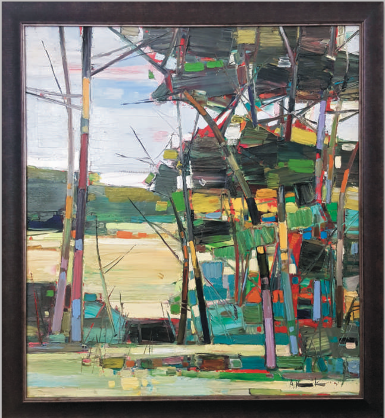
ARVYDAS KAŠAUSKAS „Peizažas“ 100x90 cm, drobė, aliejus, 2019 m.