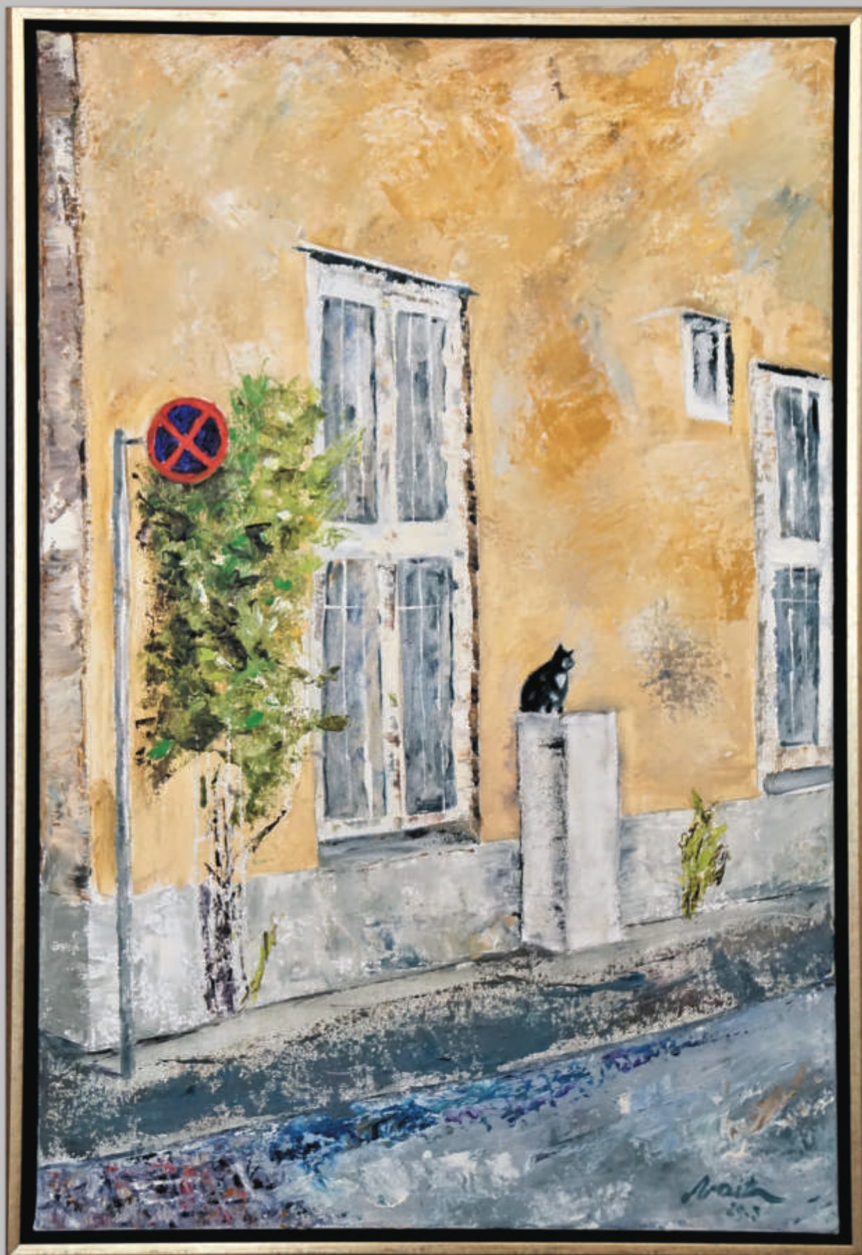
NERIUS VAITKUS „Stovėti draudžiama, sėdėti leidžiama“ 90x60 cm, drobė, aliejus, 2020 m.