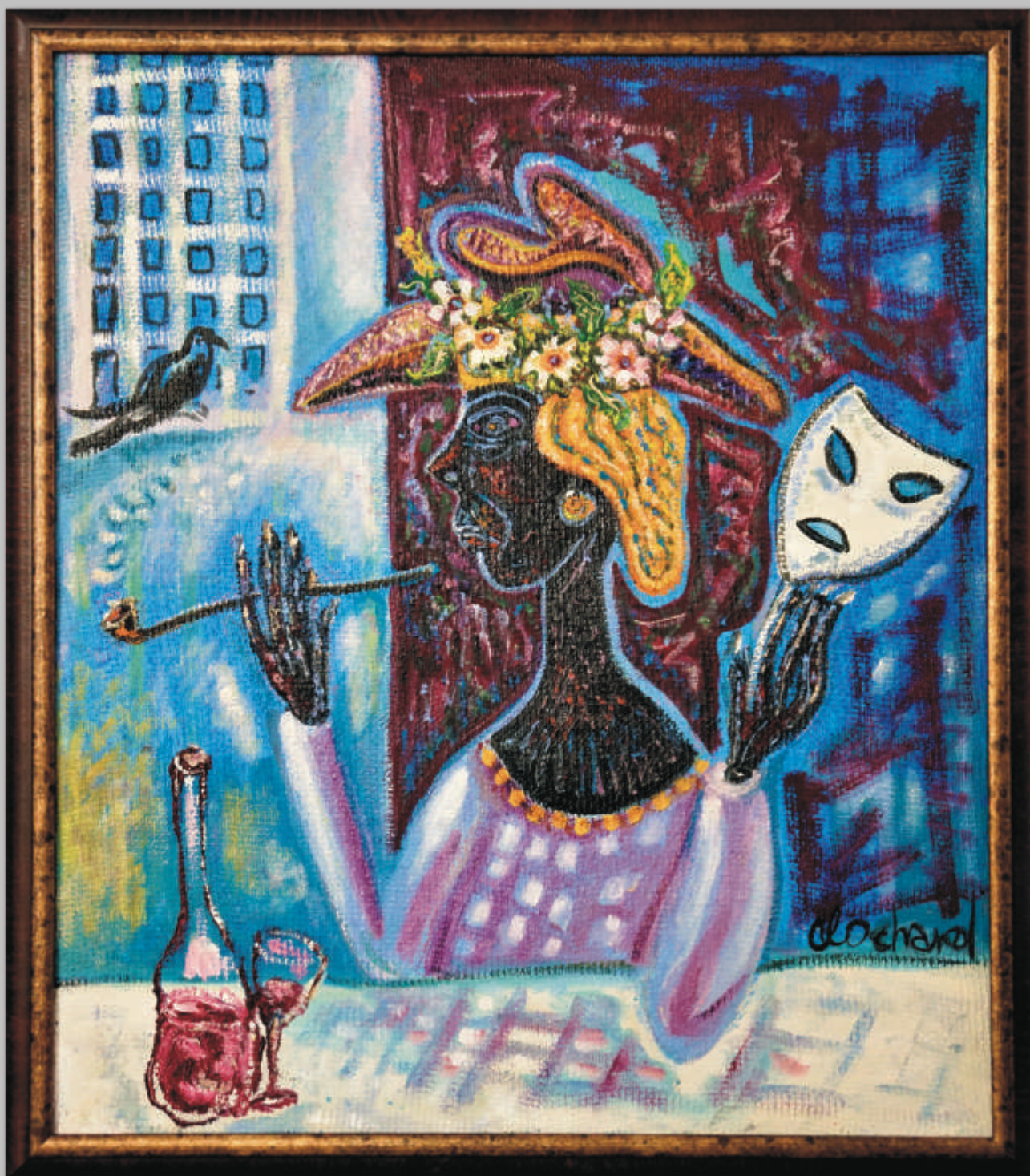
KLOŠARAS „Juodoji našlė“ 71x62 cm, drobė, aliejus, 2020 m.