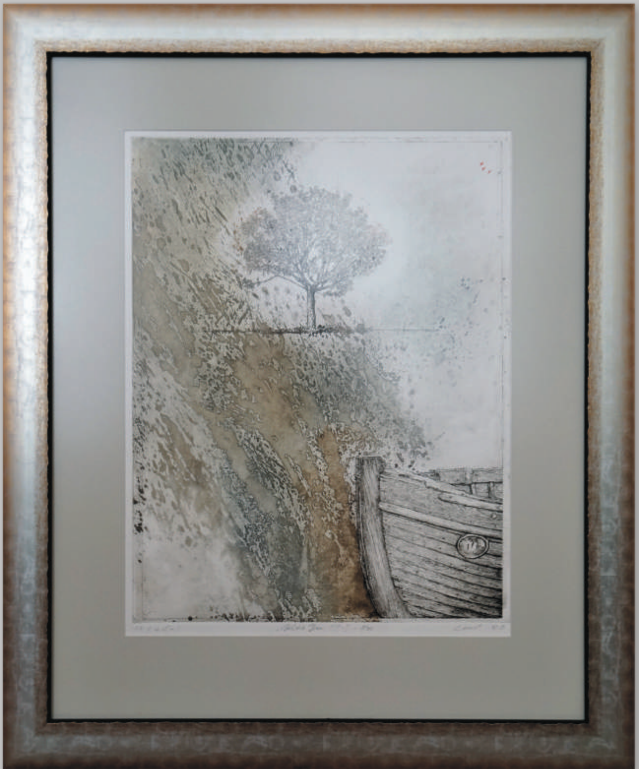
TAIBÉ CHAIT „Viltis yra“ 51x38 cm, grafika, ofortas, 2009 m.