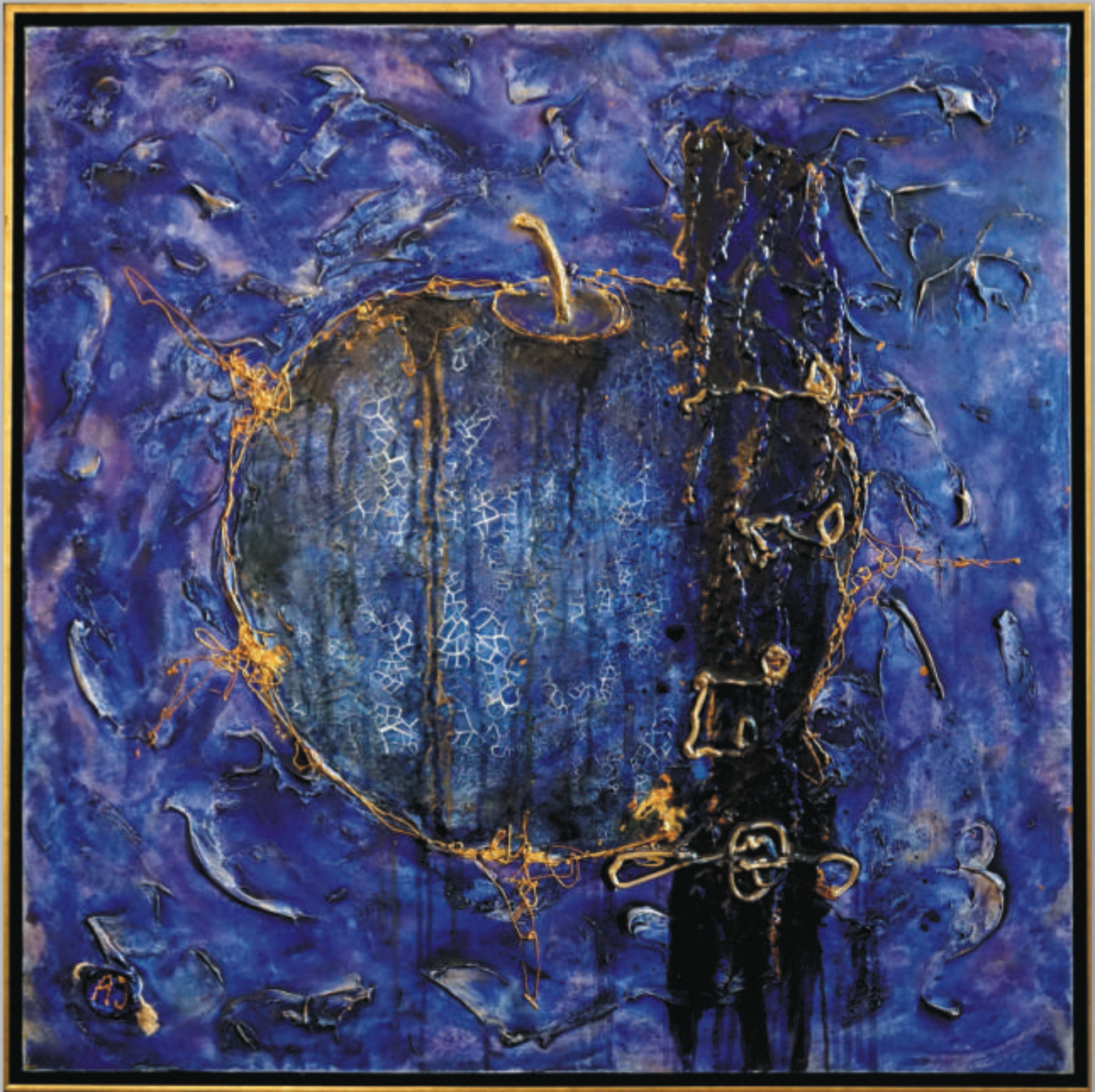
ARTŪRAS JONIKAS „Auksinis obuolys mėlynam garse“ 100x100 cm, drobė, akrilas, 2015 m.