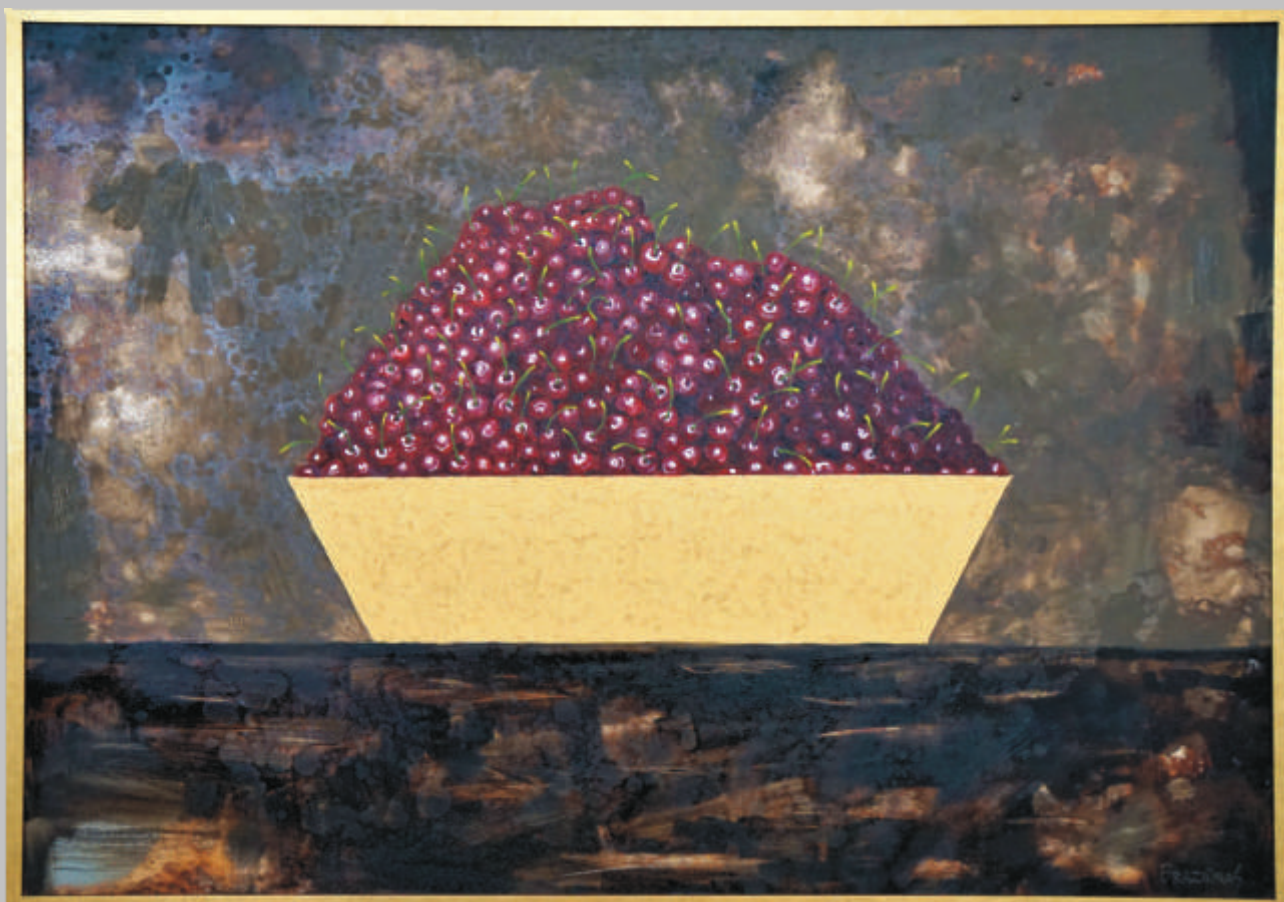
ARTŪRAS BRAZIŪNAS „Auksinės vyšnios“ 70x100 cm, drobė, aliejus, 2018 m.