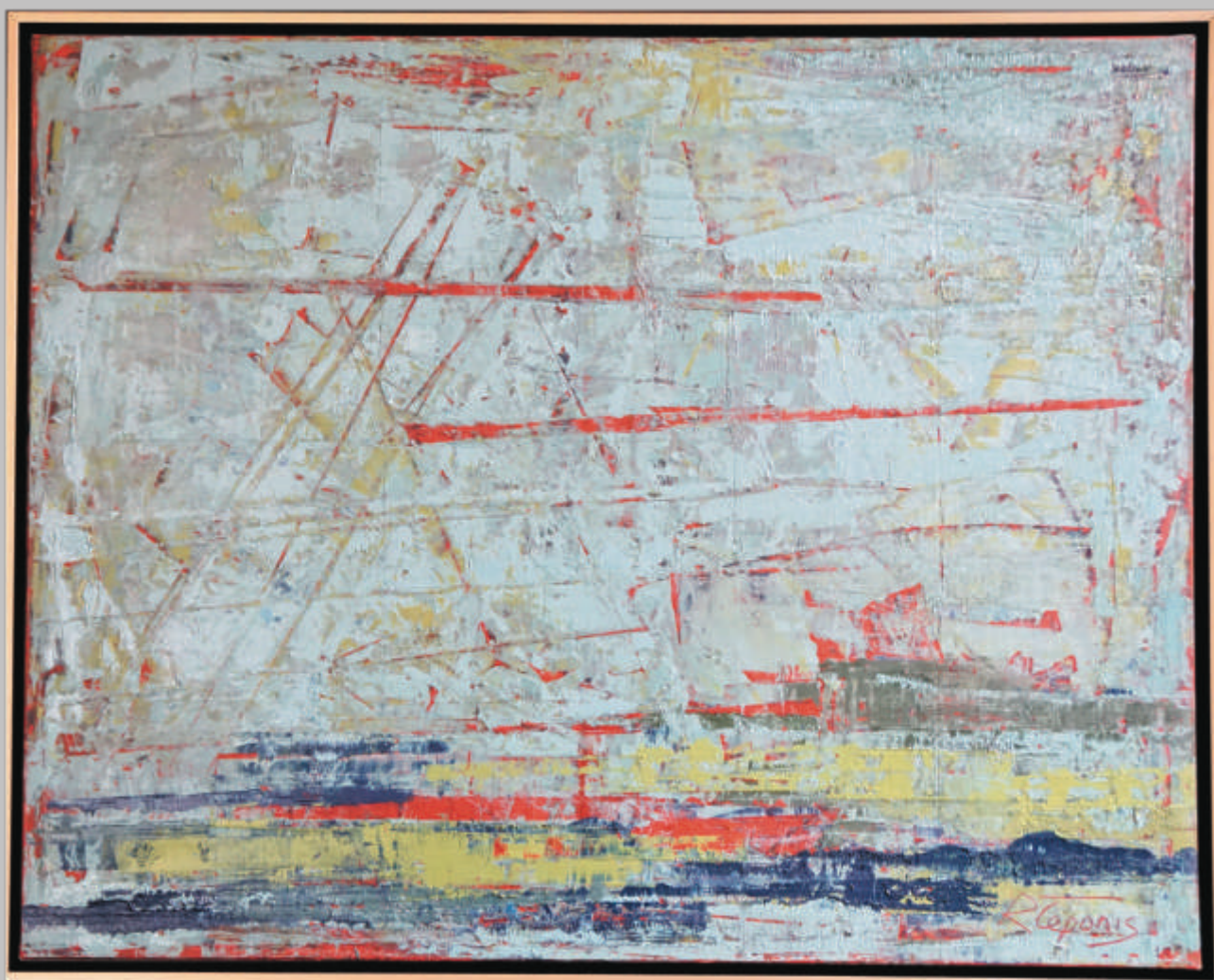
RAMŪNAS ČEPONIS „Žemaitija“ 73x92 cm, drobē, aliejus, 2015 m.