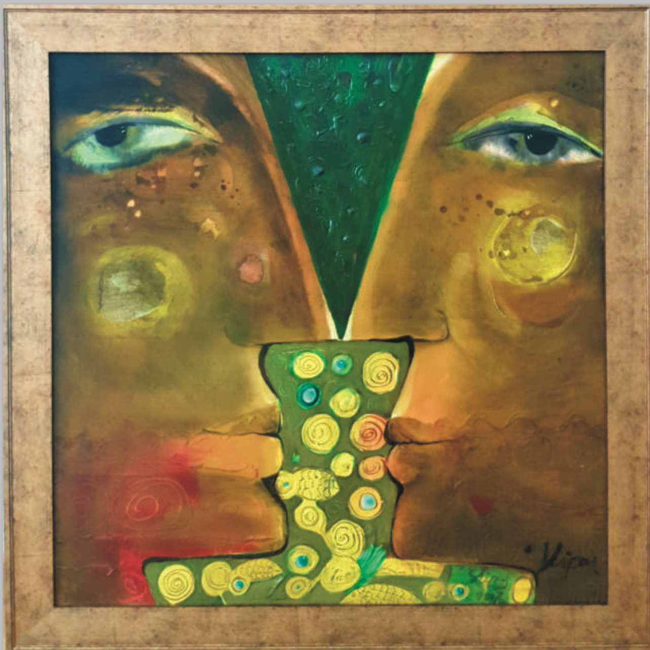
ŠLIPAS „Meilė Nr. 20“ 80x80 cm, drobė, aliejus, 2017 m.