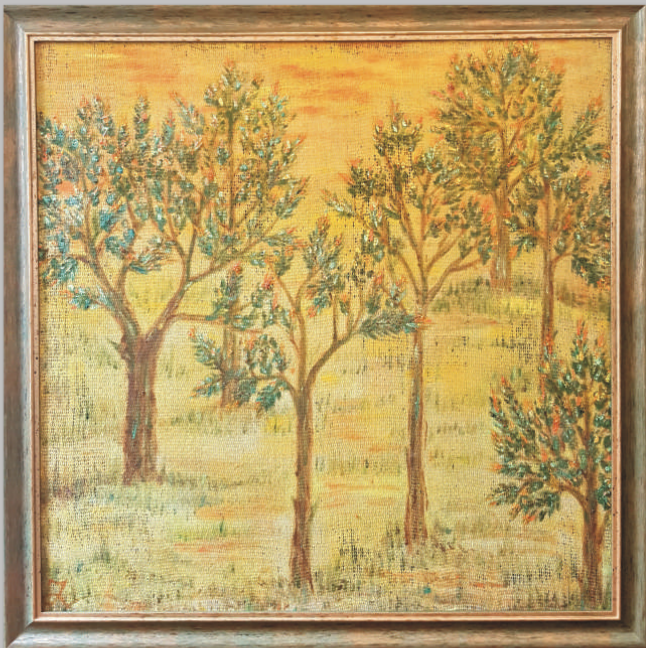
ZITA TALLAT-KELPŠAITĖ „Pušų žydėjimas“ 70x70 cm, drobė, aliejus, 2019 m.