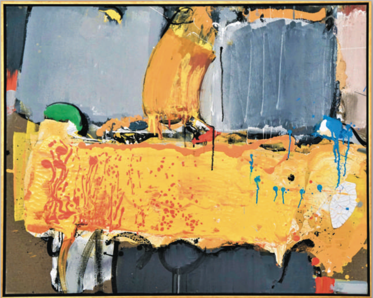
JONAS MALDŽIŪNAS „Geltonas stalas“ 80x100 cm, drobė, aliejus, 2018 m.