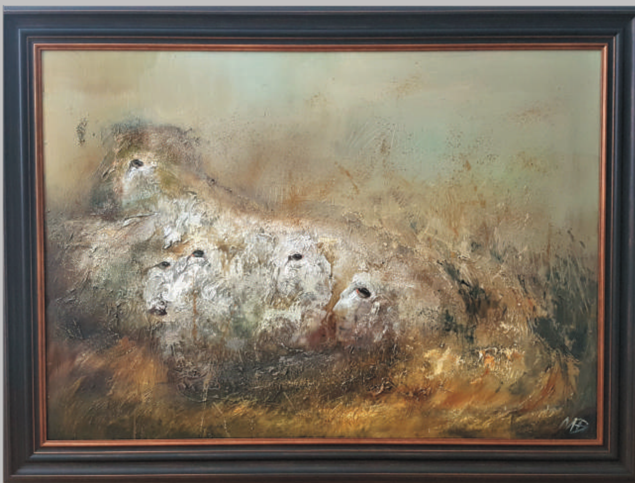
MEDA NORBUTAITĖ „Pievos akys“ 62x95 cm, drobė, aliejus, 2019 m.