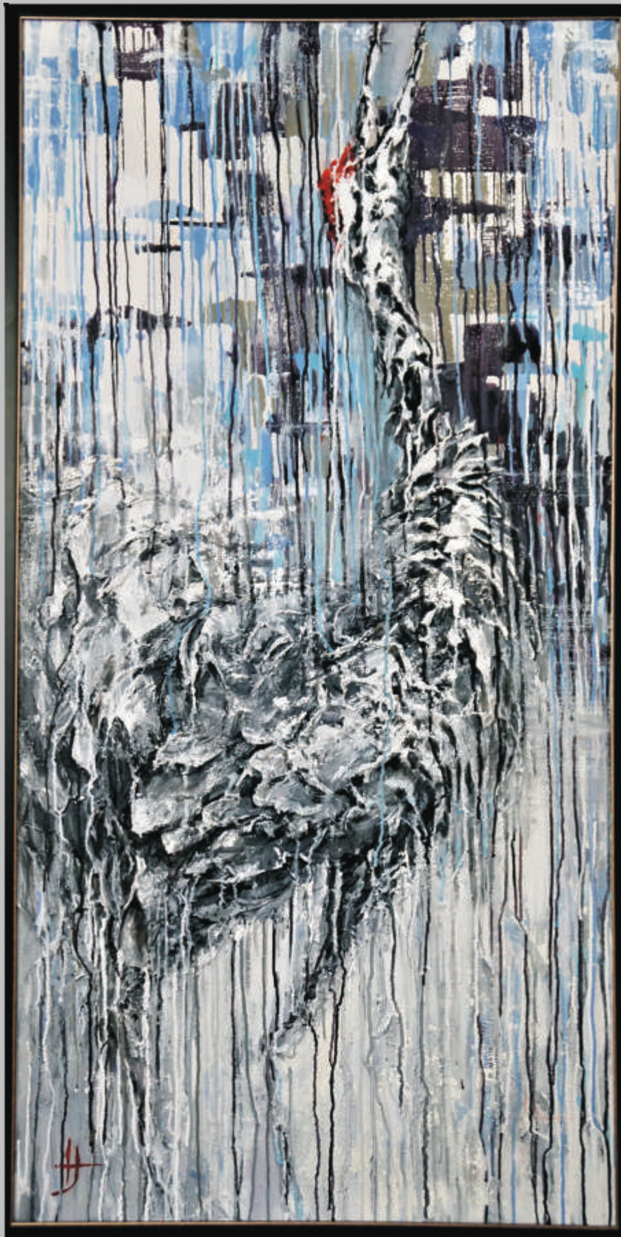
INESA ANTANAUSKIENĖ „Rytmečio skambėjimas“ 140x70 cm, drobė, akrilas, 2019 m.