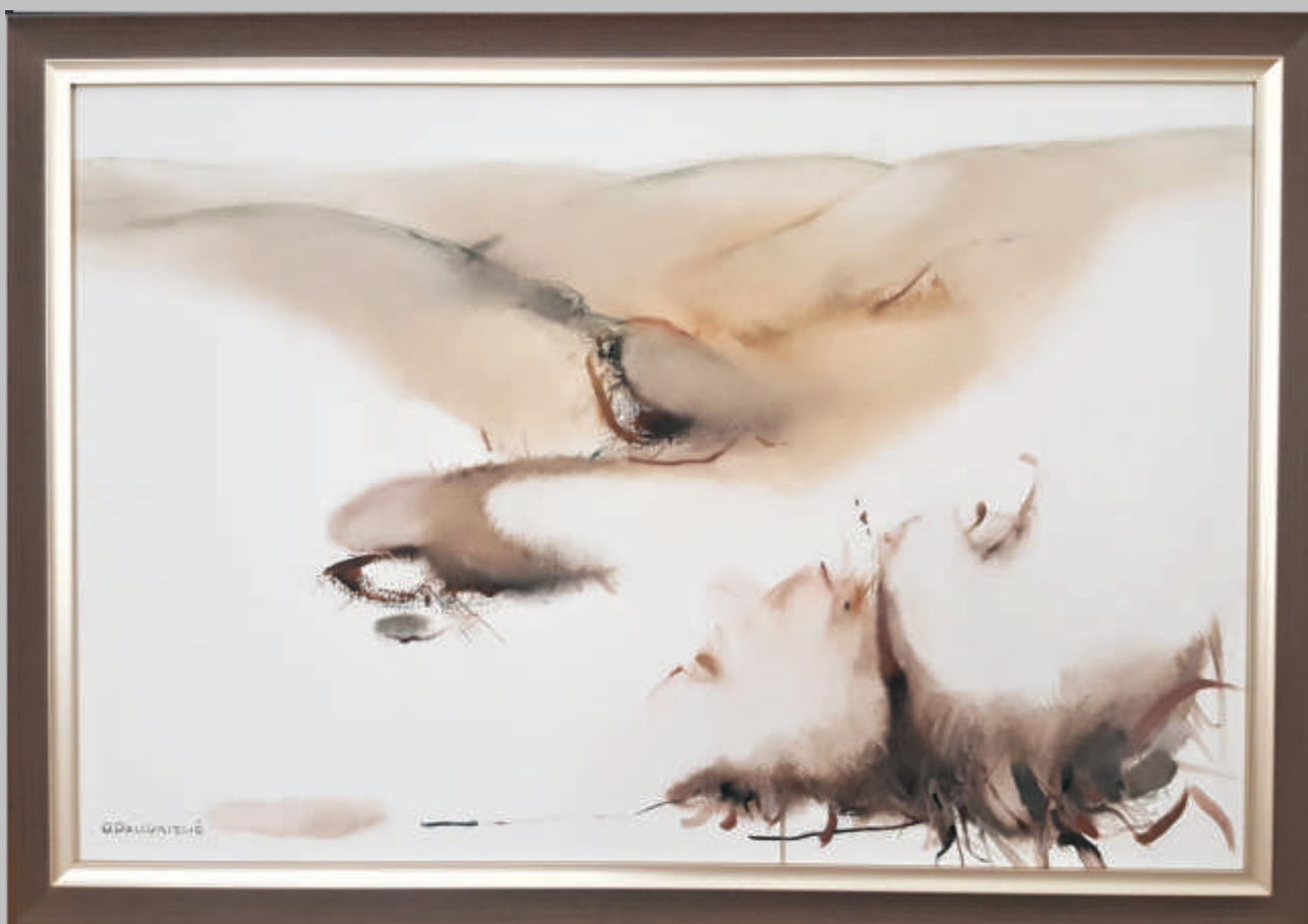
ONA PALIUKIENĖ „Kopos“ 60x90 cm, drobė, akrilas, 2020 m.